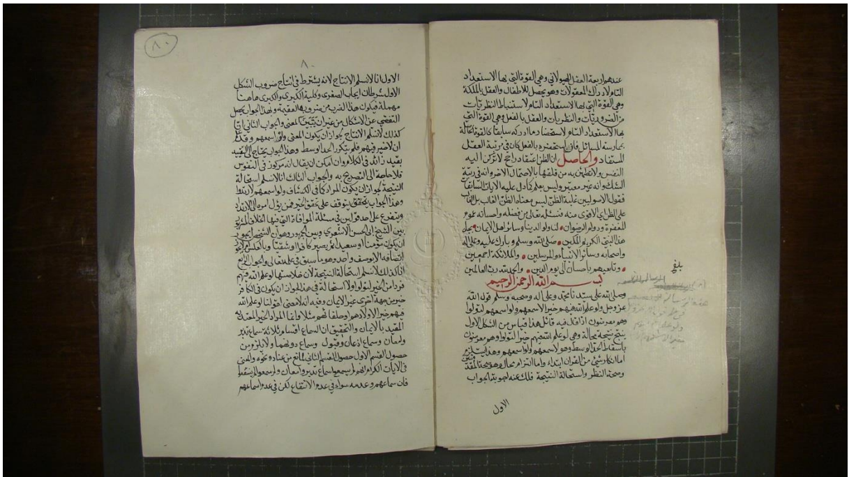
اللوحة الاخيرة من النسخة (أ)