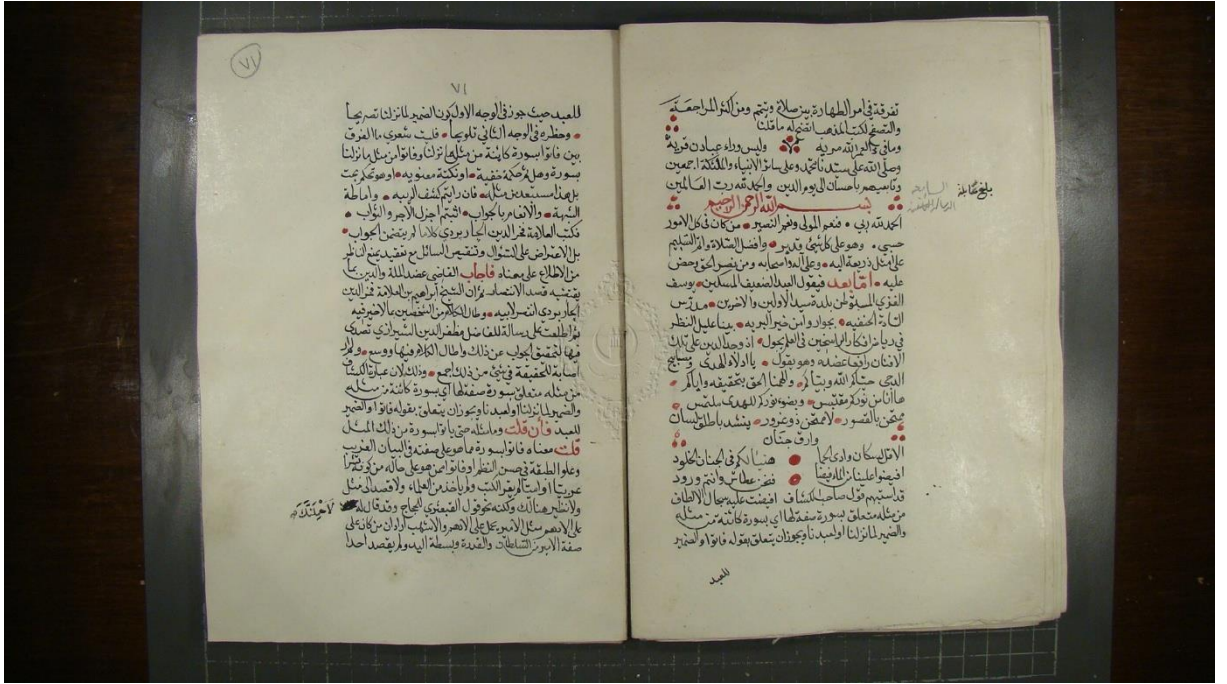
اللوحة الاولى من النسخة (أ)